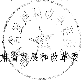
甘肃省发展和改革委员会