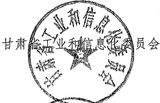
甘肃省工业和信息化委员会