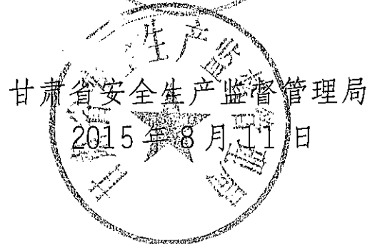
甘肃省安全生产监督管理局