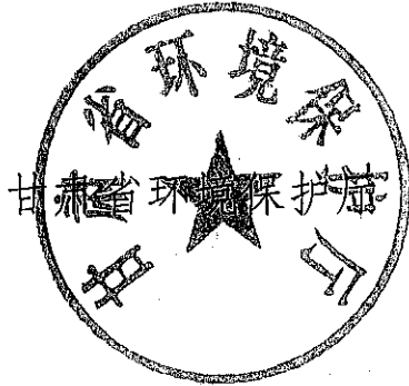
甘肃省环境保护厅

动执法机制，细化分解任务，并进行考核。省政府有关部门将对本通知落实情况进行监督检查，重大情况向省政府报告。